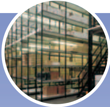
Estanterías Cargas Medias Mekar