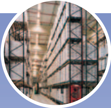
Estanterías de Paletización Karpal

Entreplantas es un elemento en nuestra gama de productos. También disponemos: