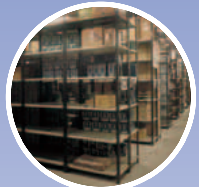
Estanterías de Ángulo Ranurado