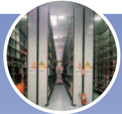
Estanterías Ligeras Linkar