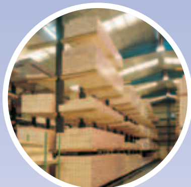
Cargas largas Karlever